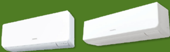
Type AS12RIX Type AS14RIX