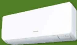
Type AS12RIX, AS14RIX