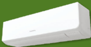
Type AS18RIX, AS24RIX